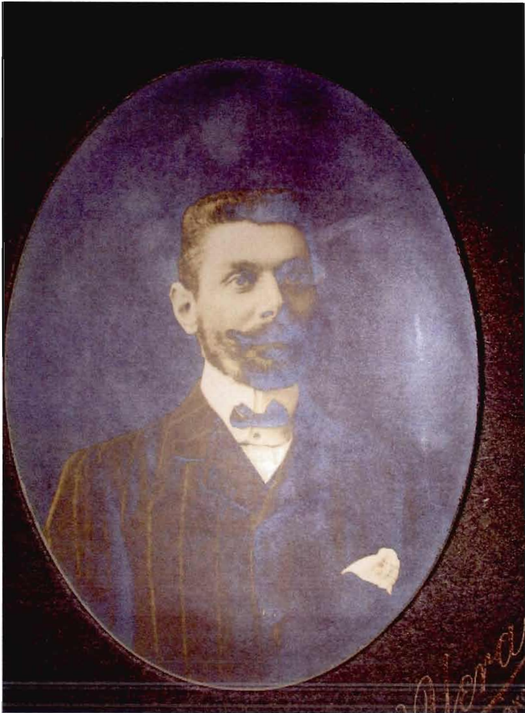
Figure 2.1 Photo de Claudius Madrolle, non datée. (Tiré de : Papiers Madrolle, PA42, c. 1, CAOM.)